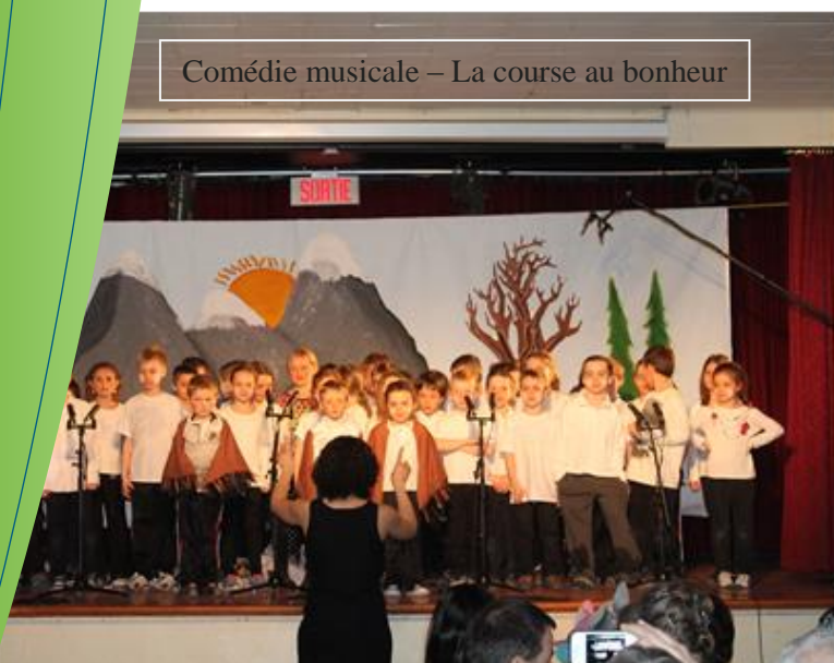
Comédie musicale – La course au bonheur